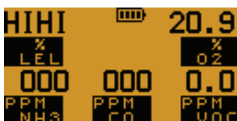
Pantalla en condiciones de alarma