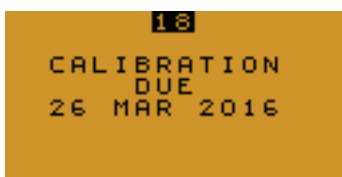
Opciones de calibración configurable