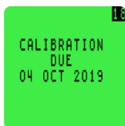
Opciones de calibración configurables