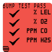
Opciones de prueba funcional configurables