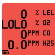
Pantalla roja en situaciones de alarma